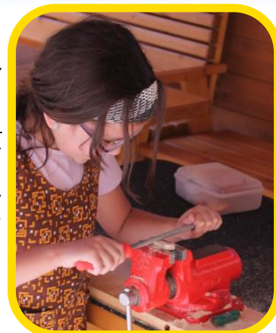
Mezi nové kroužky patří i oblíbený Malý kutil

Ponorková 3D tiskárna byla využita nejen v novém kroužku „Elektro laboratoř“, ale zároveň sloužila jako výrobní zdroj pro tisk ochranných štítů pro zdravotníky v úvodních fázích pandemie (iniciativa 3D tisk proti Covidu)