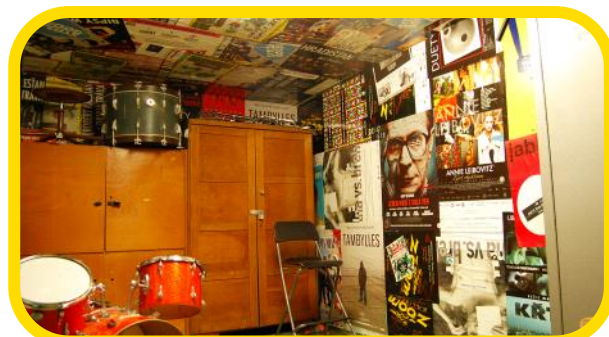
Mezi pronájmy v budově Ponorky patří i malá hudební zkušebna v suterénu