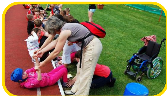
Integrovaná žákyně při atletickém Skotačení na stadionu L.Dařka

K začleňování znevýhodněných klientů do zájmového vzdělávání dochází individuálně, ve spolupráci s rodiči, případně pedagogicko-psychologickým poradcem. Velkou část našich programů (včetně nepostupových soutěží) jsme schopni znevýhodněným klientům přizpůsobit. Spolupracujeme se sociálním odborem města na možnosti úhrady poplatku za zájmové vzdělávání tímto odborem na základě žádosti znevýhodněného klienta.