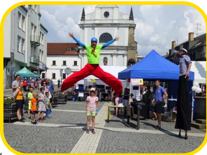
Přes veškerou nepřízeň okolností jsme červnový Den dětí s Ponorkou nakonec v Turnově uspořádali.

Plavba byla nakonec velmi bouřlivá, ale i přes nepříznivou vnější situaci mohu říci, že posádka fungovala flexibilně a jakmile se naskytl sebemenší možnost, dokázali jsme po vynuceném přerušení činnosti opět rychle vyplout. Ze všech turnovských klubů a oddílů pracujících s mládeží jsme měli na jaře nejkratší pauzu (pouze 39 prac. dní) Poděkovat musím vedoucím kroužků, kteří byli ochotni vedle své práce ještě řešit možnosti jak dětem složitý čas volna naplnit. Jsem vděčný za ochotné spolupracovníky na palubě Ponorky. Rád bych vyslovil dík i rodičům, kteří nevnímají volný čas svých dětí jako problém, ale i nadále jako příležitost.