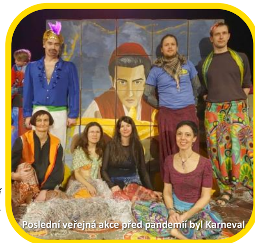
Poslední veřejná akce před pandemií byl Karneval

U vedoucích kroužků došlo k obměně v očekávaném rozsahu, radost nám dělá hlavně množství nových členů posádky (8vedoucí skončilo, 7 nových nastoupilo). Na neodborných činnostech se významně podíleli klienti OPP města Turnov.