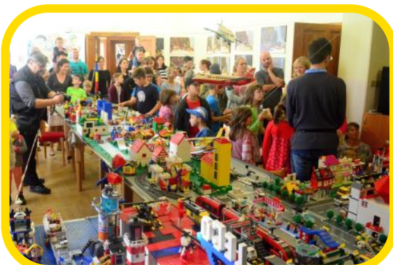
LEGOPROJEKTu se účastnilo 27 dětí a na sobotní vernisáži bylo plno.

Další plánované veřejné akce se bohužel opět neuskutečnily vlivem zákazu ze strany vlády a omezení činnosti ze strany MŠMT.