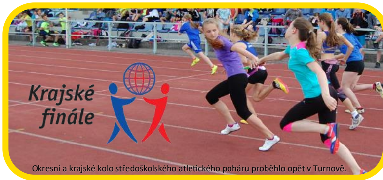
Okresní a krajské kolo středoškolského atletického poháru proběhlo opět v Turnově.

Z plánovaných kulturních přehlídek se neuskutečnily již žádné.