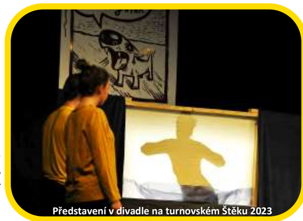
Představení v divadle na turnovském Štětku 2023

Během léta '23 jsme realizovali nejvíc táborových akcí v historii Ponorky. Trend z minulého léta pokračoval na rekordních 6 pobytových táborech, 11 příměstských a další 4 kratší pobytové akce . Obsazenost všech táborů byla 89%, celkově se účastnilo všech akcí táborového typu 411 účastníků.