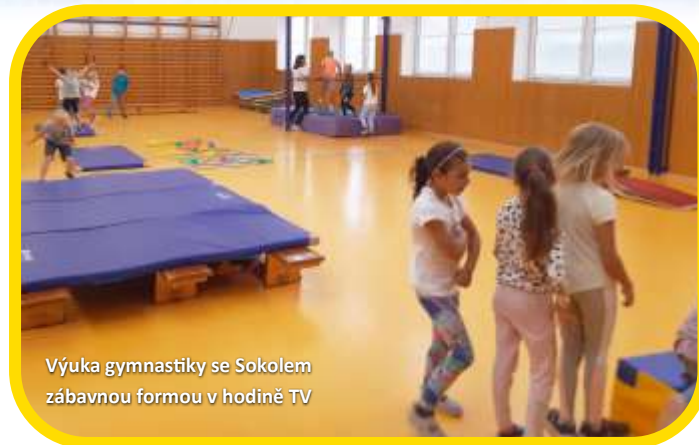
Výuka gymnastiky se Sokolem zábavnou formou v hodině TV