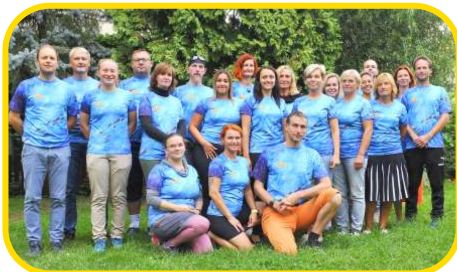
Během letošního roku jsme slavili 30 let trvání Žluté ponorky.