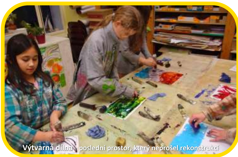
Výtvarná dílna - poslední prostor, který neprošel rekonstrukcí

Po obnově menší elektro dílny a učebny PC vznikl plán velké rekonstrukce výtvarné dílny v přízemí . Jedná se o poslední prostor v budově Žluté ponorky, který od roku 2012 neprošel zásadní úpravou.