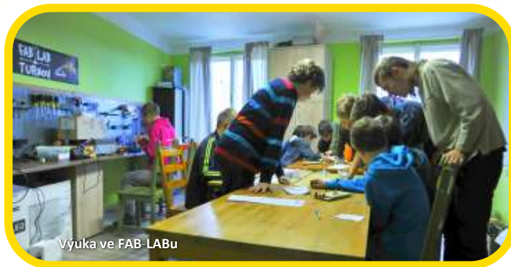
Výuka ve FAB-LABu

Současné umístění dopravního hřiště neumožňuje návštěvy veřejnosti , proto dlouhodobě usilujeme o vybudování nového hřiště vedle dráhy Pump-track v areálu Maškovy zahrady.