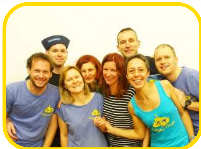
Posádka Ponorky musela letos zdolat nejen náročný vrchol

U vedoucích kroužků a kurzů došlo k mírnému propadu. Odešlo i několik dlouhodobých vedoucích z osobních důvodů. Přesto se podařilo udržet zájmovou činnost ve všech klíčových segmentech (především v přírodovědné sekci). Dále trvá očekávaný trend snižování ostatních externích zaměstnanců, protože se zbavujeme administrativní zátěže sportovních soutěží a participujeme na nich spíše metodicky.