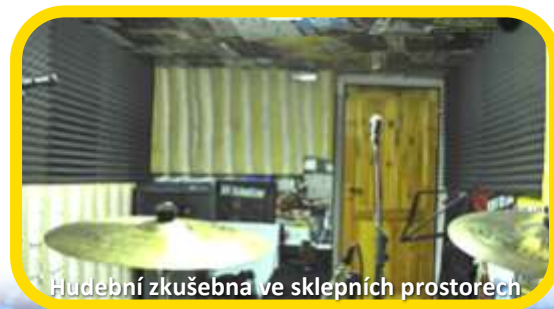
Hudební zkušebna ve sklepních prostorech

Dále příležitostný prodej občerstvení na vlastních akcích a nárzově i reklamní činnost (dle zájmu partnerů).